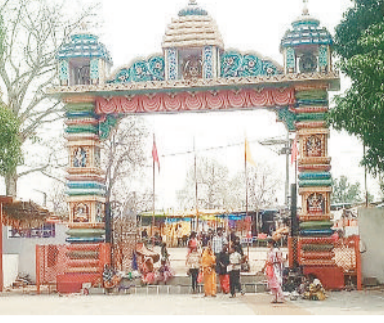
मंदिर पहुंचे श्रद्धालु।