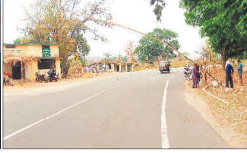
कोरिया के सीमावर्ती इलाके में लगा बैरियर।