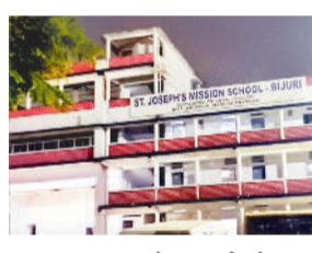
कल्याण समिति के सदस्यों से बात करने पश्चात पता चला कि संत जोसेफ मिशन स्कूल की भूमि संदिग्ध होने के साथ-साथ विद्यालय को हॉस्टल संचालित करने की अनुमति नहीं होने बाद भी संचालक द्वारा दशकों से विद्यालय में हॉस्टल

बिजुरी। कोयांचल नगरीय क्षेत्र बिजुरी का सबसे विवादित विद्यालय का तमगा हासिल किए संत जोसेफ मिशन स्कूल में उस वक्त खलबली मच गई, जब बाल विकास कल्याण समिति भोपाल एवं अनूपपुर सहित महिला एवं बाल विकास विभाग की संयुक्त टीम ने 29 मार्च को एकाएक विद्यालय पहुंचकर जांच शुरू कर दिए। और विद्यालय में भारी अनियमितताएं पाने पश्चात सभी दस्तावेजों को अपने साथ भोपाल ले गईं। बाल