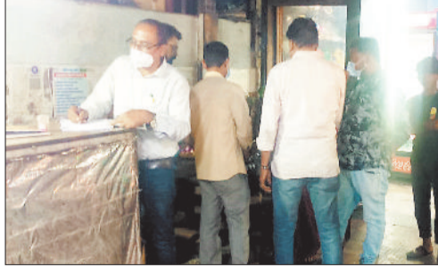
डोर टू डोर जारी सर्वे।

वहीं बीते 1 अप्रैल को शासकीय हेचरी के कर्मचारियों से 20 नेजल स्वाब नमूने लिए गए, जिन्हें परीक्षण के लिए एम्स रायपुर भेजा गया। एविएन इन्फ्लूएंजा के इलाज के लिए ओसिल्टामिविर और अन्य जरूरी टैस्टिंग सामग्री की आपूर्ति के लिए डिमांड भेजी जा रही है। स्वास्थ्य विभाग द्वारा जारी निर्देशों के अनुसार प्रत्येक व्यक्ति को इस बीमारी से बचाव के उपायों की जानकारी दी जा रही है। इसके साथ ही अधिकारियों और आम नागरिकों से निवेदन किया गया है कि किसी भी संदिग्ध मामलों की जानकारी तुरंत स्वास्थ्य विभाग को दी जाए। जिला प्रशासन ने सभी वर्गों से सहयोग करने की अपील की है। विदित हो कि बीते 29 मार्च को प्रारंभिक परीक्षण किया गया। शासकीय हेचरी सेंटर से 5 मुर्गियों के रक्त परीक्षण के लिए नमूने राष्ट्रीय उच्च सुरक्षा पशु रोग संस्थान भोपाल भेजे गए थे, इनमें 4 मुर्गियों में संक्रमण मिले थे। 31 मार्च को प्राप्त रिपोर्ट में बर्ड फ्लू संक्रमण की पुष्टि हुई। इसके बाद कलेक्टर की अध्यक्षता में बैठक आयोजित कर सभी मुर्गियों और अन्य पक्षियों को नष्ट करने के आदेश दिए गए। इसके तहत कुल 24,087 मुर्गियां, 9,998 चूजों, 2,448 बटेरों और 19,095 अंडों को नष्ट किए गए। साथ ही, शासकीय हेचरी से मुर्गी और बटेर की बिक्री पर प्रतिबंध लगा दिया गया। उल्लेखनीय है कि जिला प्रशासन ने हेचरी के एक किमी के दायरे को संक्रमित जोन घोषित कर दिया है, इस दायरे में किसी भी जगह या दुकान पर पक्षियों, मुर्गा-मुर्गी व अण्डा का वितरण करना पूर्ण रूप से प्रतिबंध कर दिया गया है, वहीं प्रभावित हेचरी केन्द्र से 10 किमी के क्षेत्र को सर्विलांस जोन घोषित किया गया।