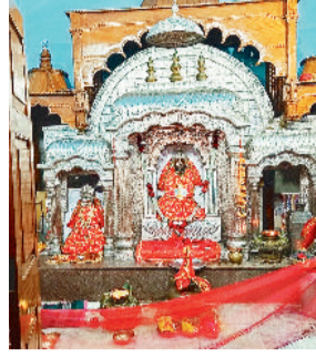
मां महामाया मंदिर।

नवरात्रि के पावन अवसर पर महामाया मंदिर चनवारीडांड में श्रद्धालुओं की भारी भीड़ उमड़ रही है। पहले दिन से ही मंदिर में भक्तों की लंबी कतारें देखने को मिल रही हैं। माता के दर्शन और पूजा-अर्चना के लिए दूर-दूर से श्रद्धालु पहुंच रहे हैं, इससे पूरे क्षेत्र में भक्तिमय माहौल बना हुआ है। मंदिर परिसर में भोग-भंडारे का आयोजन किया गया है, जहां प्रतिदिन भक्तों को प्रसाद वितरण किया जा रहा है।