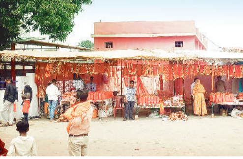
परिसर में स्थित दुकानें।